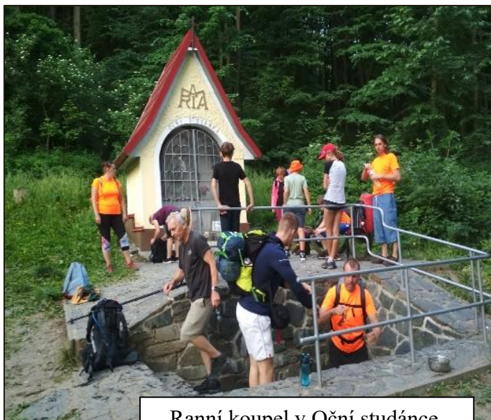
Ranní koupel v Oční studánc.

sjezdovkou u chaty nebo někteří rovnou u křížku na vrcholu. S ranním rozbřeskem v půl páté se k nám opět připojili někteří z těch, co spali doma a společně jsme přivítali východ Slunce na vrcholu.