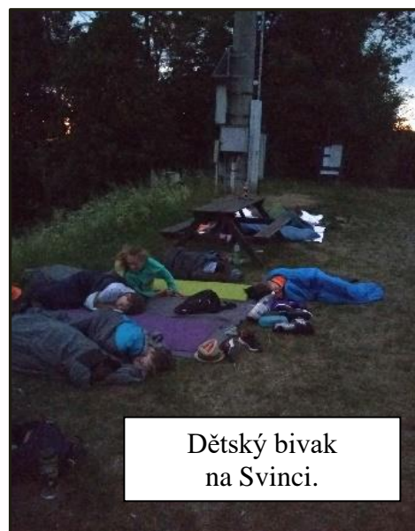
Dětský bivak na Svinci.

než přálo, protože slibovalo tropickou noc. U chaty na Svinci jsme měli s majiteli dohodnuto přespání pod širákem se zázemím v chatě. Nejvíc se těšily děti, které, ač obtěžkány spacáky a karimatkami, absolvovaly celou cestu s nadšením a očekáváním nevšedního zážitku. Na Svinci jsme se po dlouhé době zase setkali s našimi přáteli z Nového Jičina. Obrovská radost, že se opět můžeme vidět, neznala mezí, a tak jsme skoro zapomněli opéct připravené špekáčky. Do pozdních nočních hodin jsme debatovali o tom, jak jsme prožívali tzv. lockdown a jak jsme si všichni chyběli. Poté část turistů vyrazila na cestu zpátky. Ti nejzdatnější to vzali domů „ještě zkratkou“ nočním výšlapem přes Petřkovskou hůrku. Dvanáct turistů a osm dětí pak přespalo pod širákem nad